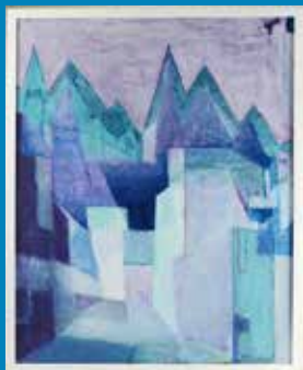
Sieh um dich V, Heinrich Feld, 2000 © Museum am Dom Trier.