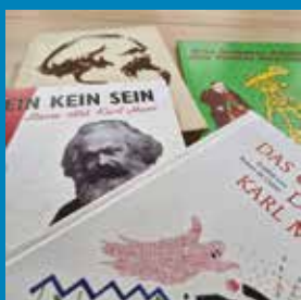
Karl Marx im Kinderbuch © Karl-Marx-Haus.