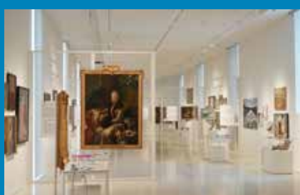
Blick in die Sonderausstellung „Tell Me More. Bilder erzählen Geschichten“