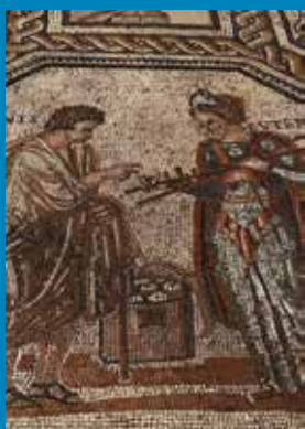
Musemosaik im Rheinischen Landesmuseum Trier.