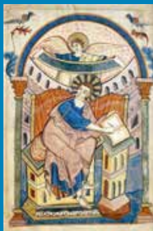
Miniatur aus dem Ada Evangelist: Evangelist Matthäus