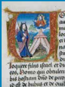
Dreibändige Bibel, 1511 bis 1526, Wissenschaftliche Bibliothek der Stadt Trier, Foto: Anja Runkel