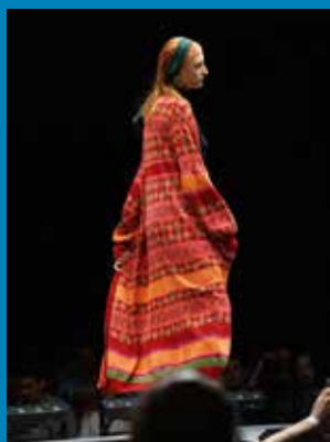
Modeentwurf aus der Kollektion „Azania“ von Modedesignerin Wadzanai Marowa, 2022, Stadtmuseum Simeonstift Trier