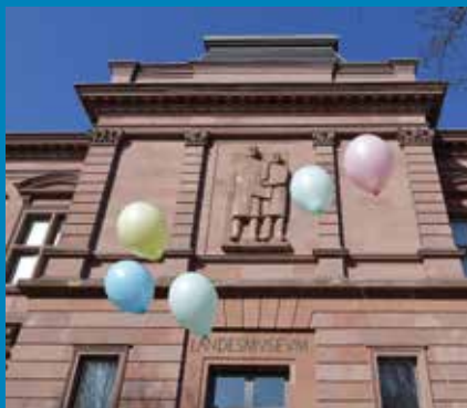
Rheinisches Landesmuseum Trier, ©GDKE, RLM Trier, Th. Zühmer