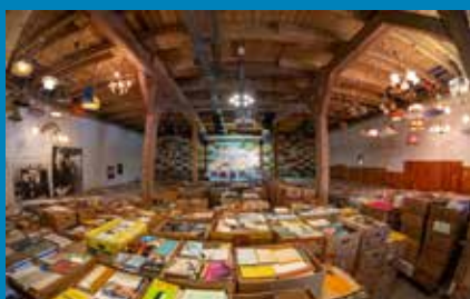
Vergessene Bücher